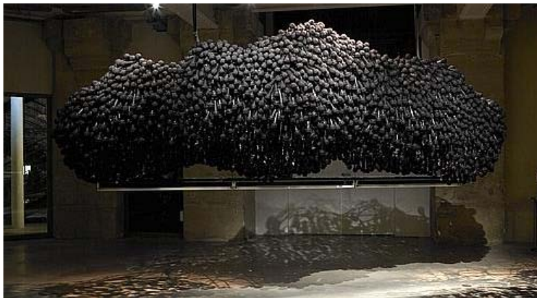
Singing Cloud - Assemblage de micros et d'éléments sonores. Marc Damage

Valérie Duponchelle (Figaroscope) 25/02/2009 | Ajouter à ma sélection