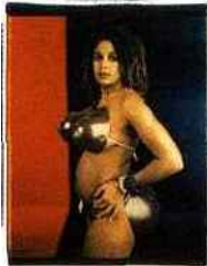
Venus Hottentot 2000, 1994, Lyle Ashton Harris en collaboration avec Renee Cox

Au parc de La Villette, le lancement de la Saison créole , qui durera toute l’année 2009, est marquée par l’ouverture de l’exposition « Kréyol Factory, des artistes interrogent les identités créoles ». Celle-ci présente les œuvres de 60 créateurs des îles Caraïbes ou de l’océan Indien, mais aussi d’Afrique et des diasporas européenne ou américaine. Avec 85 œuvres d’art plastique ou installations, 250 photographies et neuf espaces documentaires, elle montre comment s’y sont constitués l’imaginaire collectif et les identités, ce qu’il y a de commun ou de spécifique à chacune de ces îles ou régions, peuplées par la traite et colonisées de différentes façons. « Kréyol Factory » suit un parcours thématique découpé en sept séquences : « Traversées »,