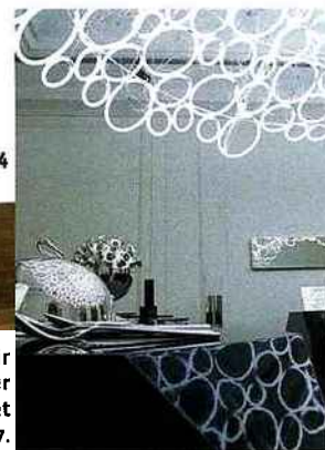
1 Andrea, le premier produit commercialisé de la famille Bel-Air de filtres à air végétal. 2. Le LaboShop la boutique du Laboratoire, centre d'expérimentations sur les relations entre art et science. 3 Local River, unité de stockage pour poissons et plantes. 4. Scénographie réalisée pour Christoffle, à l'occasion des Designer's Days 2007.