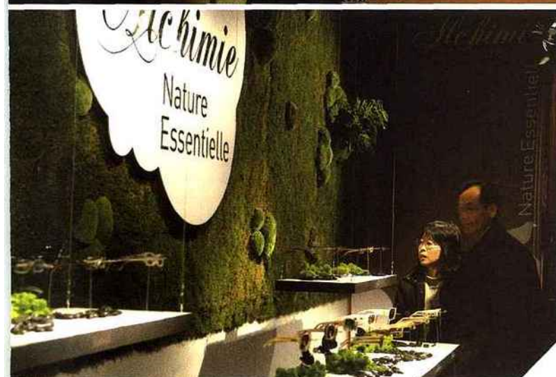
La tendance trouve son application dans la scénographie des événements : ici une ambiance tantôt poétique, tantôt développement durable imaginée par Carlin International pour le Silmo.