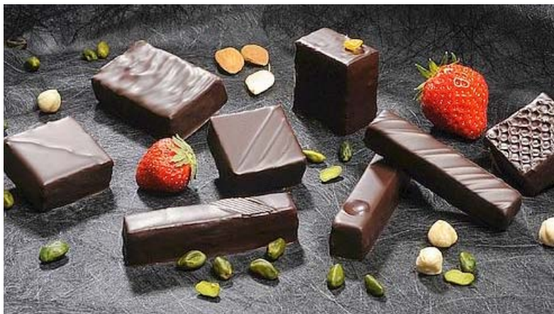
Les succulents chocolats de Noël Jovy

16/10/2009 | Mise à jour : 17:35 | Commentaires 4 | Ajouter à ma sélection