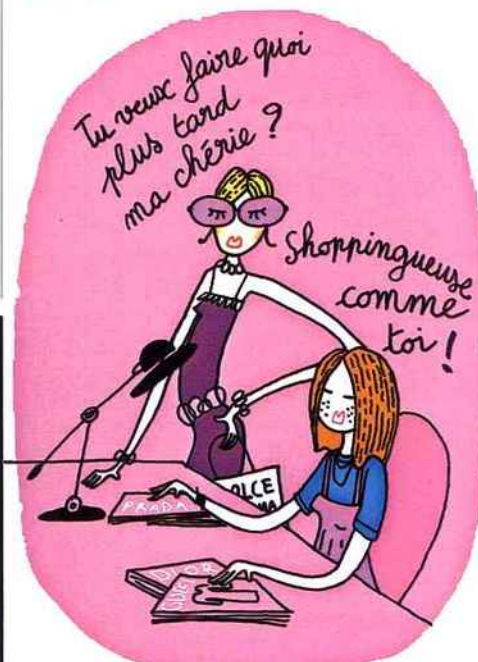
PRESSE (X 4). JAKE DYLL. VÉRONIQUE DE VIGUERIE. ILLUSTRATION MICHEL LAURENT.

Quelle orientation choisir ? Pour quel métier ? Quels débouchés ? Rendez-vous sur www.lecanaldesmetiers.tv , plateforme très sérieuse conçue pour informer les jeunes et les aider à construire leur projet professionnel. Au menu, plus de 12 000 métiers d'avenir, des vidéos, des témoignages, des conseils... Egalement les clés pour trouver un stage. Bref, le CIO dont on a rêvé.